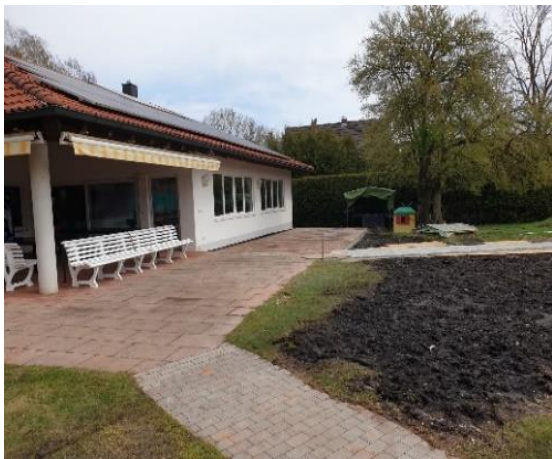
Die deutlich vergrößerte Terrasse bietet nun noch mehr Platz zum Grillen und Zuschauen.

Über den Winter haben wir Konzepte zu verschiedensten Investitionen und Erneuerungen erarbeitet. Neben dem Kauf einer neuen Spülmaschine und der Anschaffung von zwei abschließbaren Schaukästen mit Beleuchtung und im Zuge dessen der Entfernung der alten Belegungstafel, haben wir ein großes Projekt zum Laufen gebracht. Es ist uns eine Herzensangelegenheit, dass sich unsere Mitglieder auf der Anlage wohlfühlen und auch das Zuschauen Spaß macht. Daher haben wir uns für die Beschaffung und Installation von sieben massiven Sitzbänken (vier Bänke auf dem Ostwall und drei Bänke auf dem Westwall) mit einer Bepflasterung unter den Bänken entschieden. Auch die vordere Treppe auf dem linken Ostwall soll erneuert werden. Damit der Zuschauerbereich für alle gut erreichbar ist, wurde der alte Kiesweg von der Terrasse bis zum Aufgang der „renovierten Treppe“ am linken Ostwall gepflastert. Des Weiteren ließen wir den ca. 1 Meter breiten Kiesstreifen vor der Stirnseite von Platz 1 entfernen und säen dort Rasen an. Damit entsteht eine von der Terrasse bis Platz 1 durchgehende Rasenfläche. Durch Entfernung der alten Kantensteine (Stolperkante) können auch Zelte z.B. für das Sommerfest besser aufgebaut werden. Die Terrasse wurde bis zum Grill deutlich vergrößert und eine zusätzliche Markise auf der Südseite angebracht.