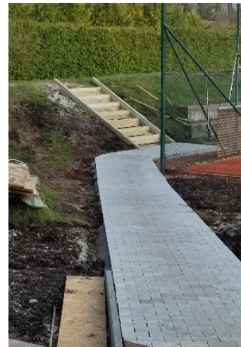
Der neue Catwalk für SpielerInnen und Fans.